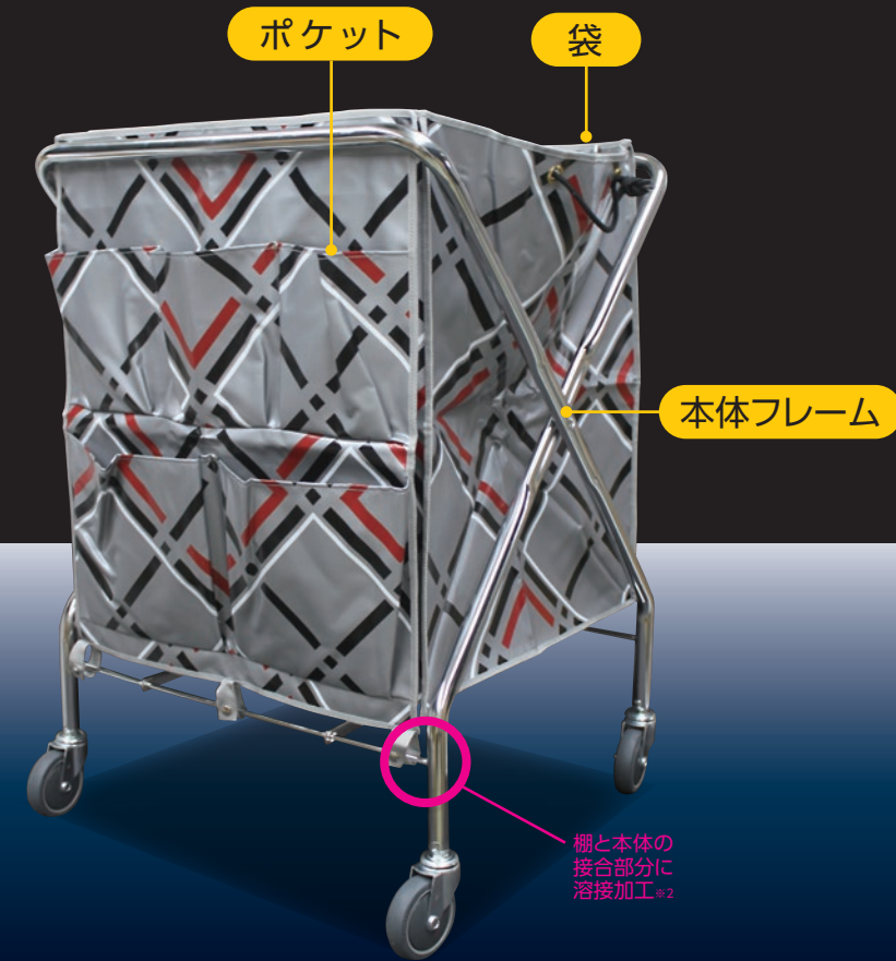
TBYダストカー(セット)大