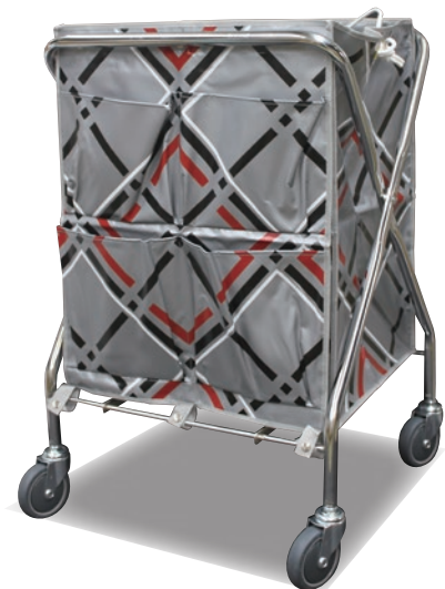
TBYダストカー(セット)小

材 質 大φ25.4、小φ22.2スチールパイプにクロームメッキ サイズ 小約W557×D506×H813mm、大約W664×D646×H915mm 重 量 約5kg、約7.5kg キャスター直径 φ100